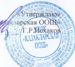
График оценочных процедур на 1 полугодие 2023-2024 учебного года МБОУ «Казакларская ООШ»